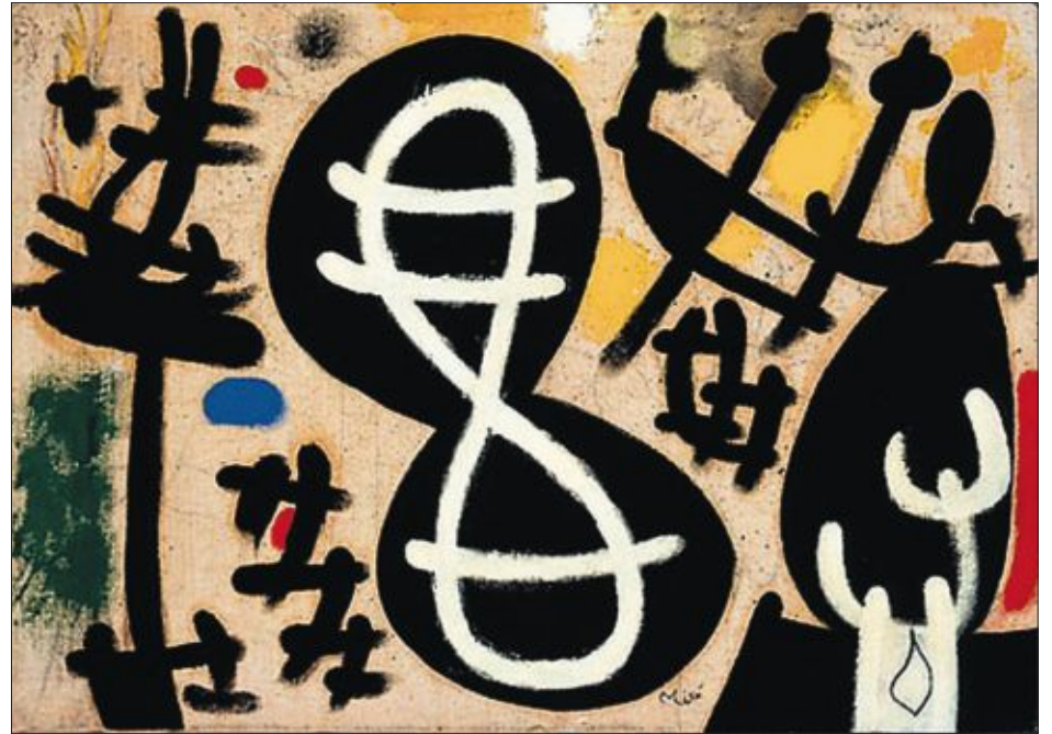
Dos de las obras de Joan Miró que figuran en la muestra La luz de la noche , que permanecerá abierta hasta el 15 de agosto en el Museo de Arte Contemporáneo de Ibiza.